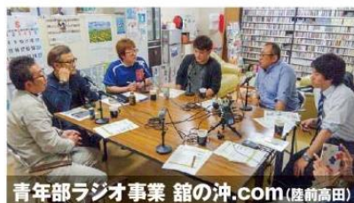
青年部ラジオ事業 館の沖.com(座前高田)

地域の未来を担う人材として、同じ志を持った仲間と共に活動してみませんか? 経営者としての資質向上、幅広い人脈作り、地域振興活動への参加による貢献に興味がある方はぜひ!