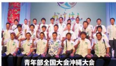
青年部全国大会沖縄大会

青年部員企業の経営力向上を図り、地域のリーディング企業として飛躍させるため、経営計画策定セミナーや経営革新計画認定企業の輩出を目指したセミナーを開催しています。