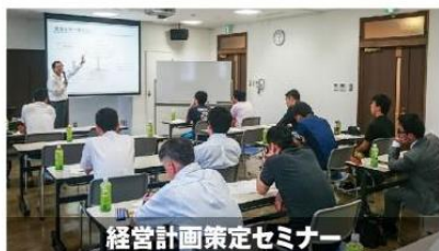
経営計画策定セミナー